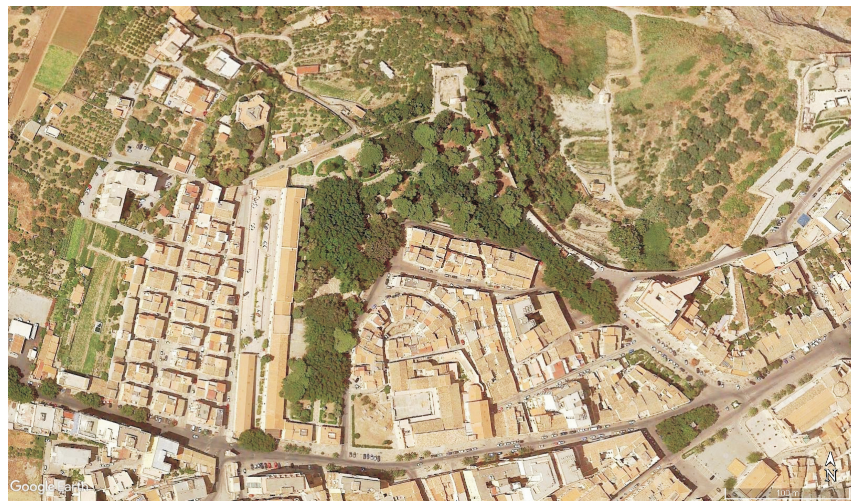
FOTO AEREA DELL'AREA INTERESSATA DALL'INTERVENTO