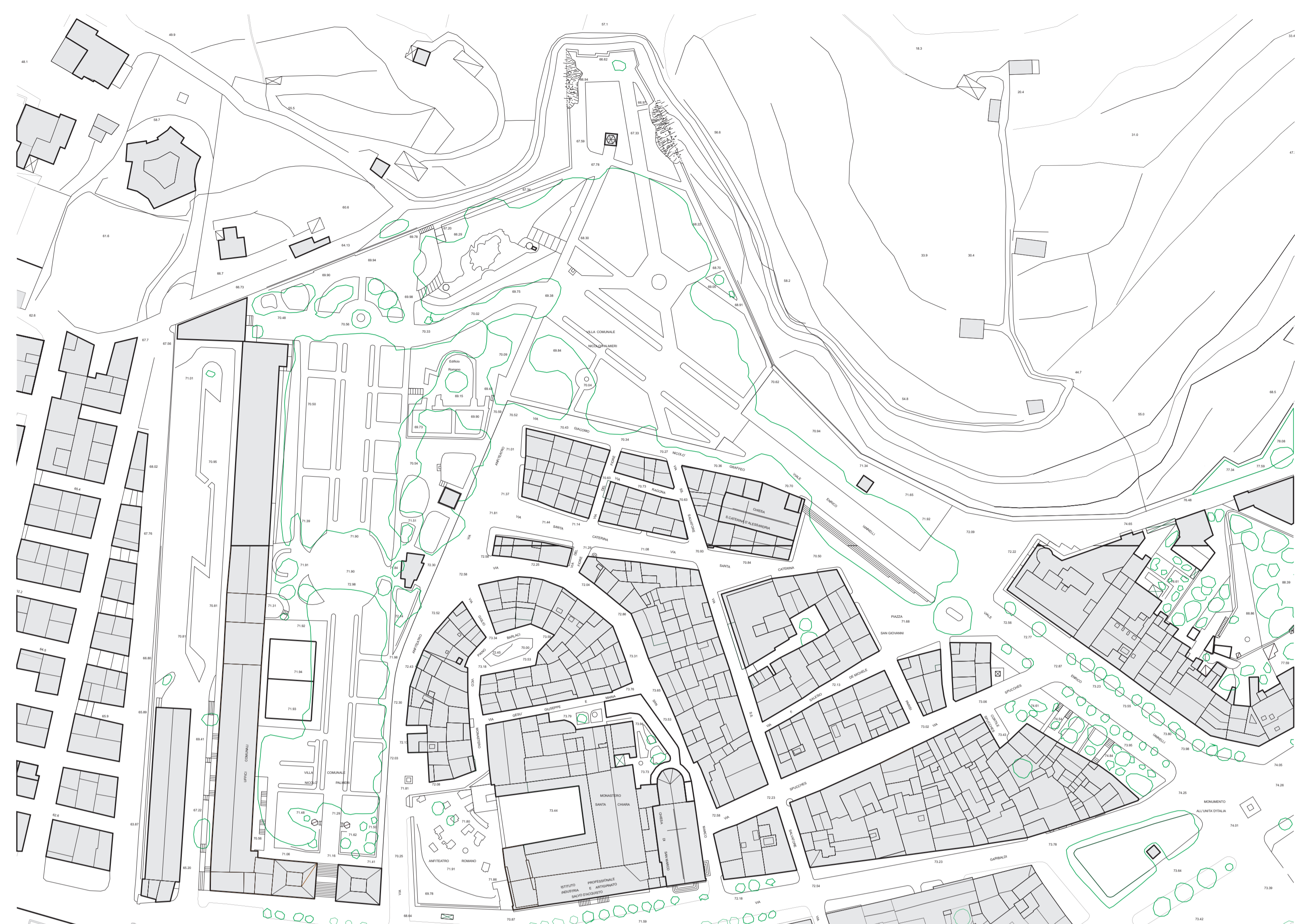
PLANIMETRIA STATO DI FATTO 1:1000